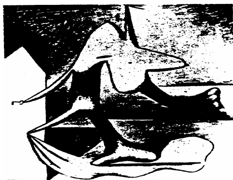
3 畢卡索的炭筆畫, 1927

培：因為我不知道造形是怎麼形成的。舉個例吧，有一天我在畫某人的頭像，是什麼形成眼睛、鼻子還有嘴的窩洞呢？如果你仔細加以分析，這些窩洞造形根本與眼睛、鼻子、嘴無關；然而顏料由一個輪廓游移到另一個輪廓，產生出和我所要描繪的人物的一些相似點來。我停了：我想了一下子，這更接近我原先所想要的。第二天，我試著更進一步，使它變得更尖銳、更酷肖，可是我卻完全失去了這個影像。因為這個影像如同在抽象與具象間走鋼索。它可能一直走到抽象；也可能和它一點也沒有關係。那是把具有形體的東西更狂暴地、更尖銳地提昇到神經系統之上的一種嘗試。