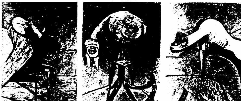
1 <<三件釘刑圖台基人物習作>>, 1944

席：三聯畫(triptych)之後，你開始傾向比較具有形體的繪畫：是因為你有這樣的渴望呢？還是你感到那時候無法更進一步地發展那種有機造形呢？