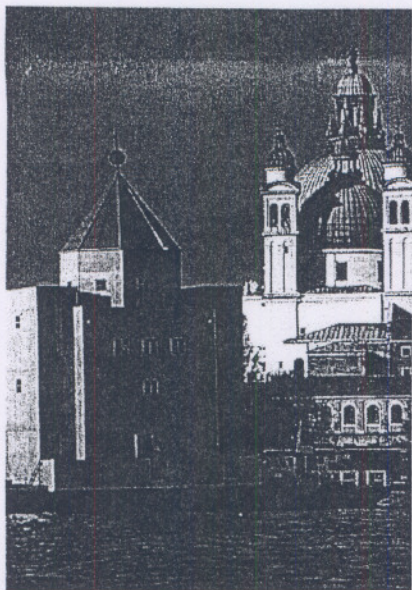
圖四：Rossi 所設計的海上劇場

B. 在電影明天過後中，人類面臨第二次冰河時期的危機，將被迫與冰天雪地奮戰，以求存活。請你假設你將為人類設計一座能在如此險峻環境中繼續運作的城市（或是建築物）；在你畫下設計之時，同時請以文字說明你設計如何能運作。以下參考圖形為英國建築集團 Archigram 所設計的「爆炸村莊」。(100%)